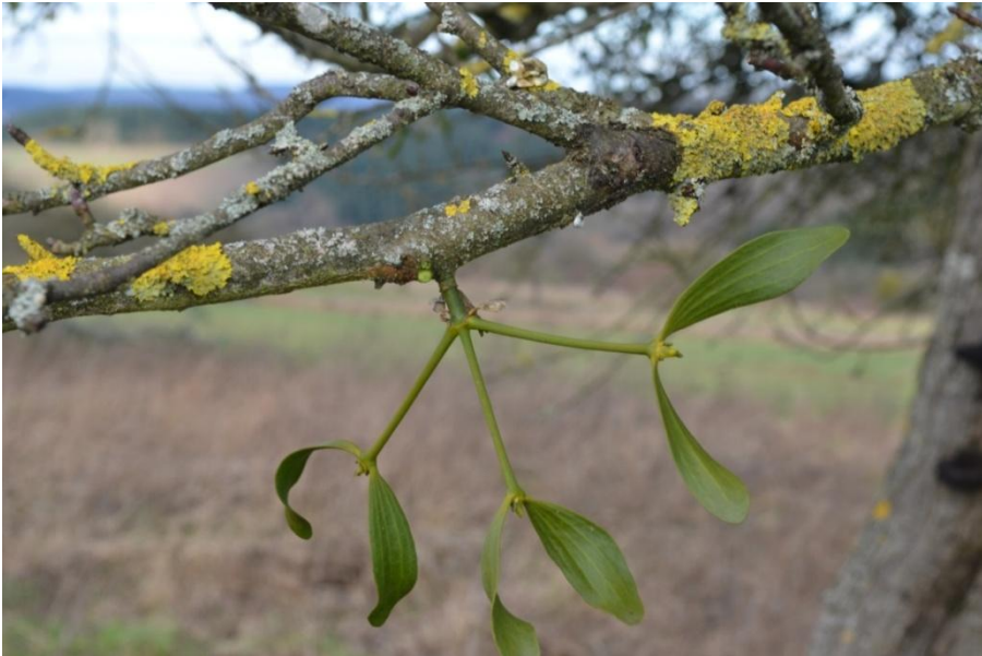
Abb. 2: 4-jährige Mistel im Wirtsholz eines Apfelbaums